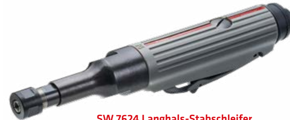
SW 7624 Langhals-Stabschleifer