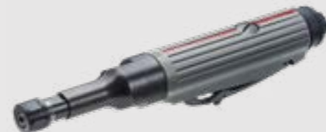
SW 7624 | 783784