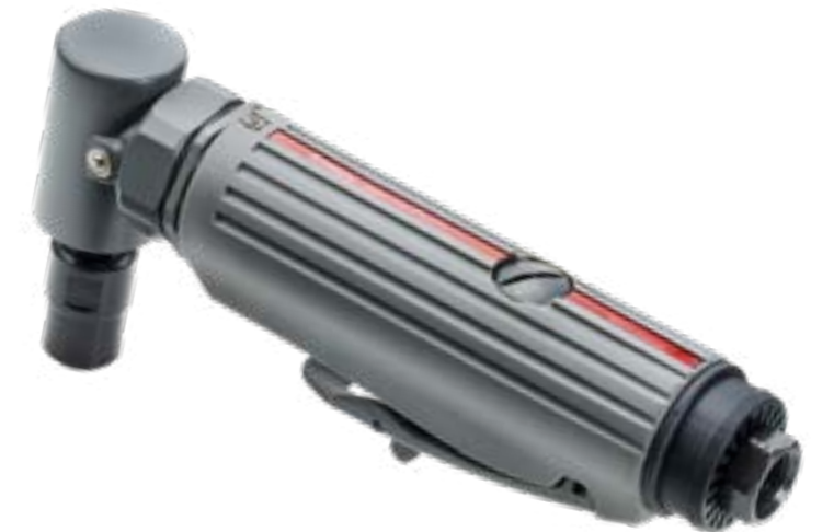
SW 7625 Winkelschleifer