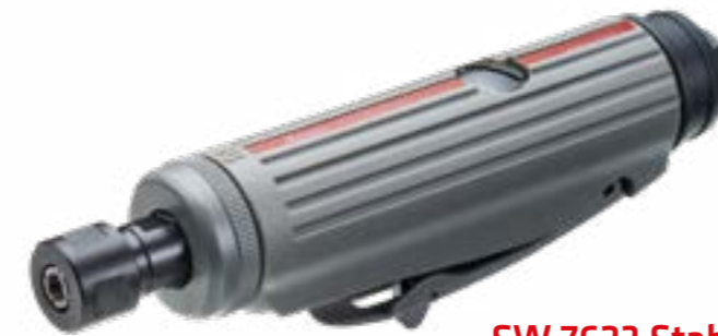
SW 7623 Stabschleifer