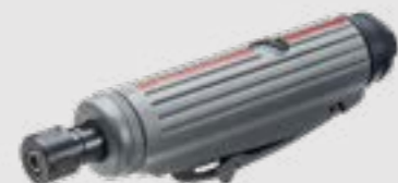
SW 7623 | 783783